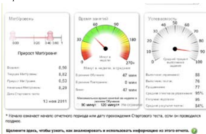
Рис. 3. Индивидуальный отчет ученика о работе в Мат-Решке. Вариант 2