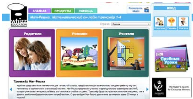
Рис. 1. Главная страница компьютерной среды для изучения математики с индивидуальным планированием и контролем «Мат-Решка»