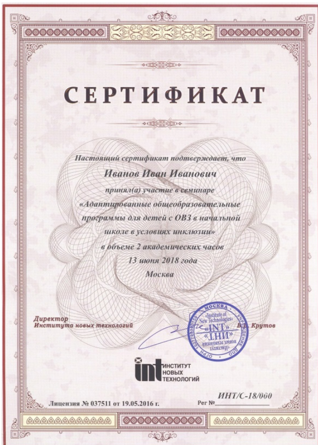
Рис. Образец сертификата