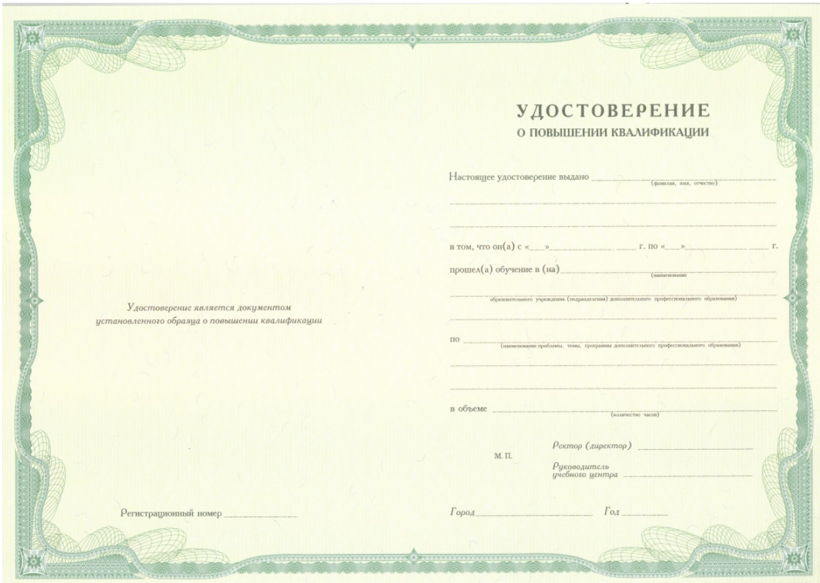
Рис. Разворот удостоверения о повышении квалификации